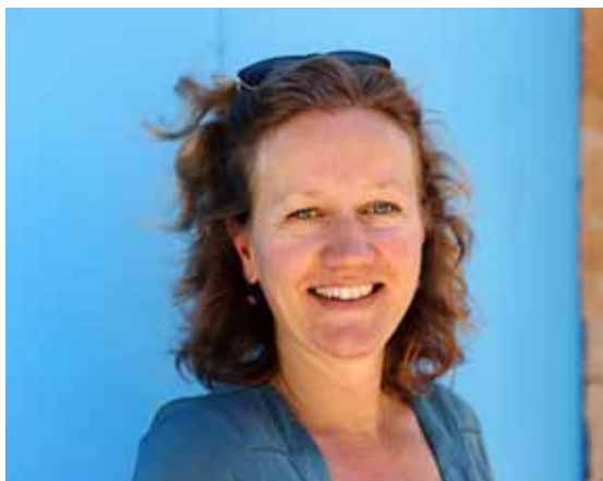
Brigitte Kramer ist freie Journalistin und lebt auf Mallorca. Ihr Handwerk hat sie an der Münchner Journalistenschule gelernt. Seit Jahren berichtet sie für die radioReisen aus Spanien und Portugal