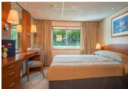
2-Bett Oberdeck Deluxe