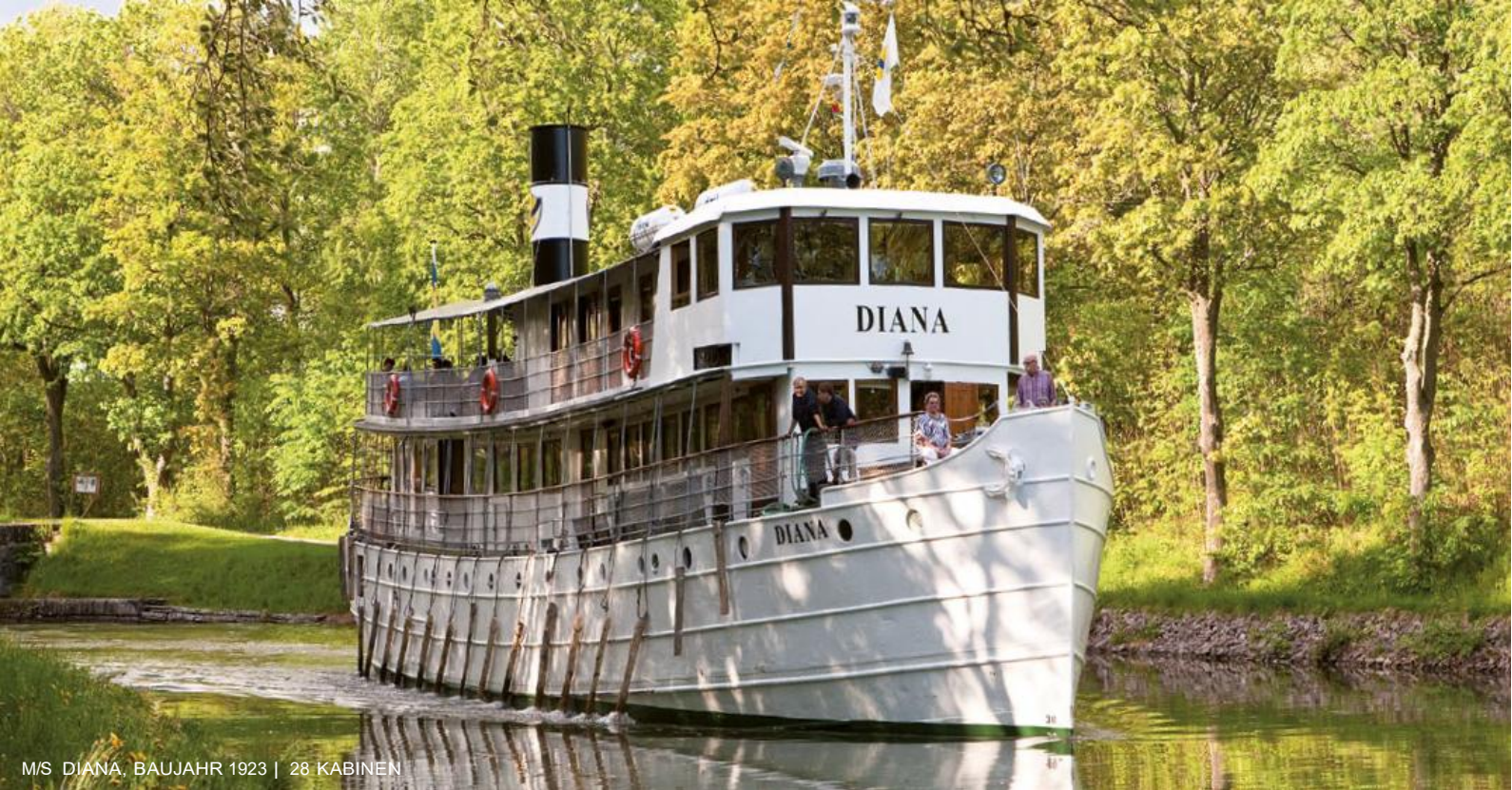
M/S DIANA, BAUJAHR 1923 | 28 KABINEN