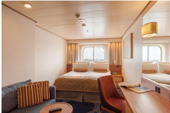
Beispiel Außenkabine mit Fenster