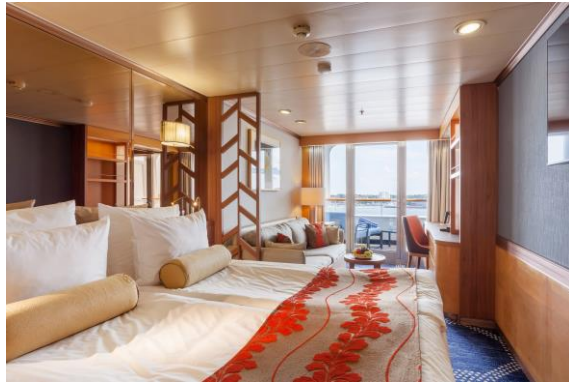
Beispiel Außenkabine mit Balkon