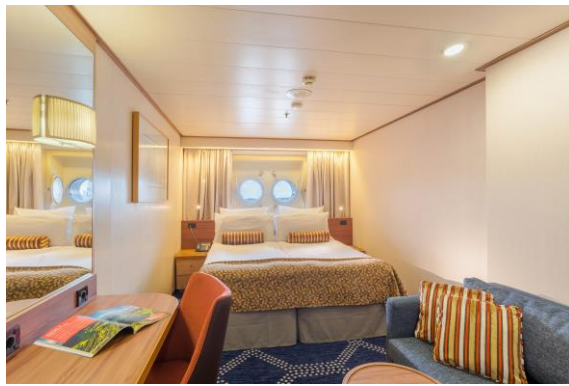
Beispiel Außenkabine mit Bullauge