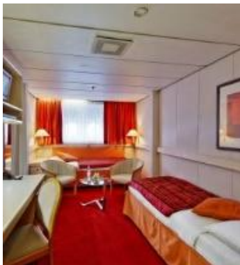
P – Außenkabine, Deck 3

Beschreibung: Die Außenkabine der Kategorie P ist ca. 19 m 2 groß und mit einem Doppelbett oder wahlweise zwei Einzelbetten ausgestattet. Das Badezimmer besitzt eine Dusche und WC. Des Weiteren verfügt die Kabine über einen Fernseher, einen Kühlschrank, Satellitentelefon, Klimaanlage sowie einen Föhn. Für die Gepäckaufbewahrung ist zudem ein Schrank vorhanden. Sicht nach draußen gewähren zwei Bullaugen. Die Dreibettkabinen verfügen über zwei Unterbetten und ein Oberbett.