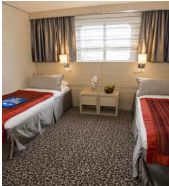
O - Außenkabine (eingeschränkte Sicht), Deck 5 + 6

Beschreibung: Die Außenkabine der Kategorie P ist ca. 19 m 2 groß und mit einem Doppelbett oder wahlweise zwei Einzelbetten ausgestattet. Das Badezimmer besitzt eine Dusche und WC. Des Weiteren verfügt die Kabine über einen Fernseher, einen Kühlschrank, Satellitentelefon, Klimaanlage sowie einen Föhn. Für die Gepäckaufbewahrung ist zudem ein Schrank vorhanden. Sicht nach draußen gewähren zwei Bullaugen. Die Dreibettkabinen verfügen über zwei Unterbetten und ein Oberbett.