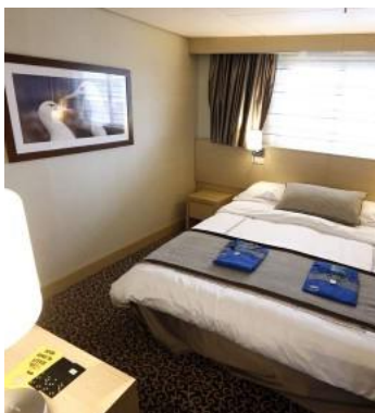
D - Außenkabine (freie Sicht), Deck 4 + 5 + 6

Beschreibung: Die Kabinen dieser Kategorie wurden 2016 und 2017 renoviert. Die Außenkabinen der Kategorie O sind mit einem Doppelbett oder zwei Einzelbetten sowie einem Bad mit Dusche/WC ausgestattet. Zudem befinden sich ein Fernseher sowie ein Kühlschrank in der ca. 19 m 2 großen Kabine. Ein Schrank, Klimaanlage, Föhn und Satellitentelefon sind ebenfalls vorhanden. Durch Rettungsboote ist die Sicht nach draußen durch die Panoramafenster eingeschränkt.